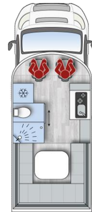
i 590FF H