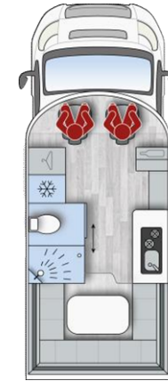
i 590FT H